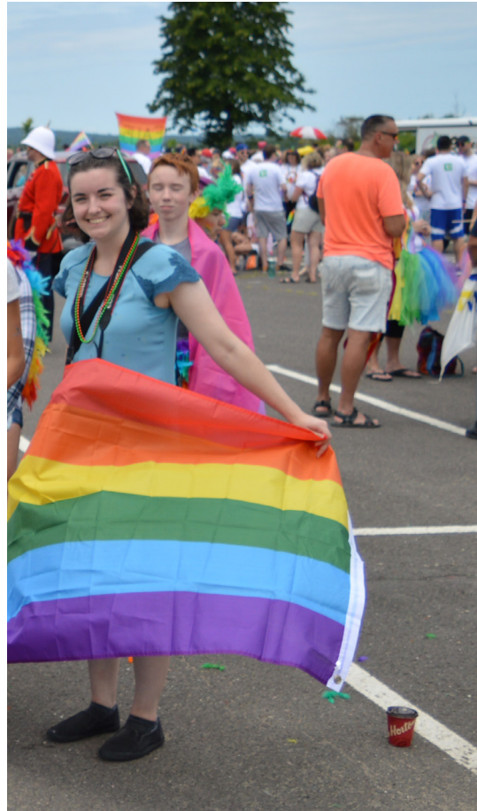
Célébration de la Fierté avec les travailleurs sociaux & amis, août, 2018