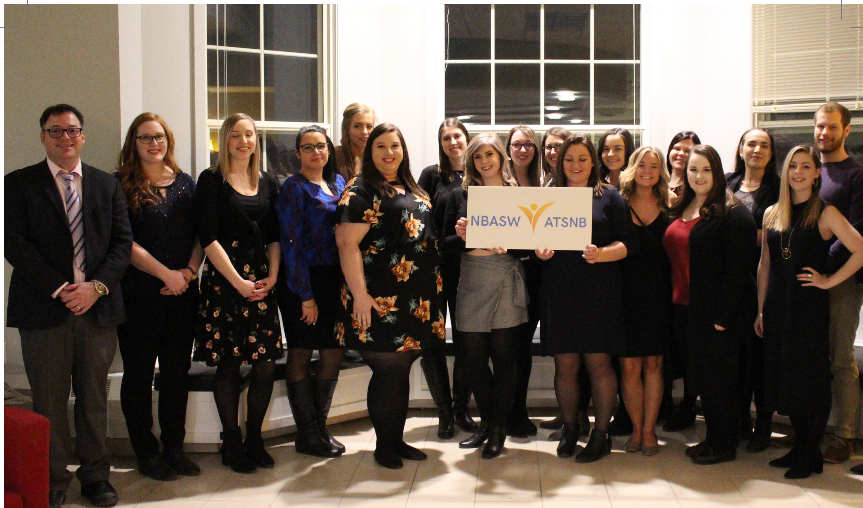
Événement vin et fromage à St. Thomas University, décembre 2018