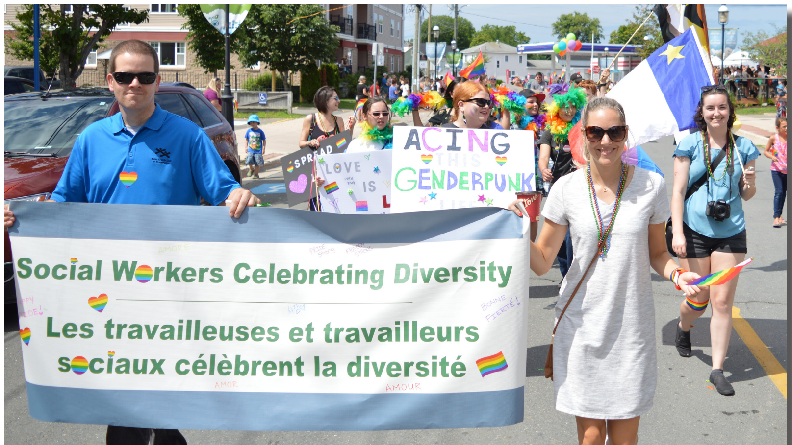
Célébration de la Fierté avec les travailleurs sociaux & amis, août, 2018

La vision de l'ATTSNB est celle d'un organisme professionnel qui est à l'image des valeurs auxquelles on est attaché dans le travail social, qui donne l'exemple en matière de déontologie et qui inspire confiance à la population.